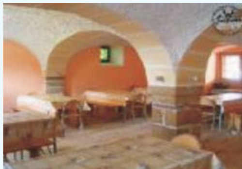
Refektarz w Domu Rekolekcyjnym w Janicach.